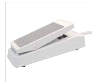
2 Артикул 444.0452.0