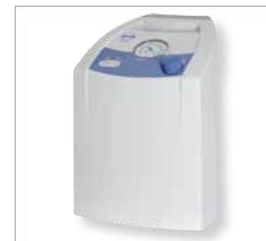
2 Артикул 340.0300.0