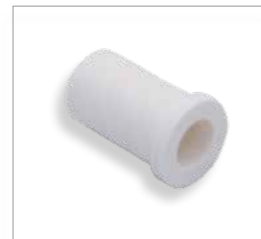
1 Артикул 340.0054.0