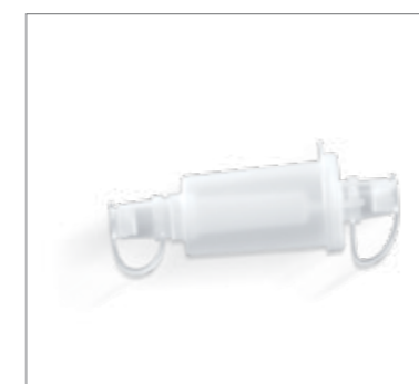
4 Артикул 401.0555.0