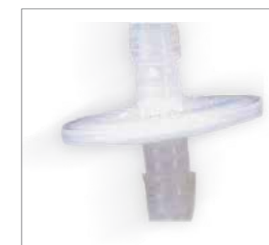
5 Артикул 443.0738.0