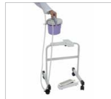
1 Артикул 340.0035.0