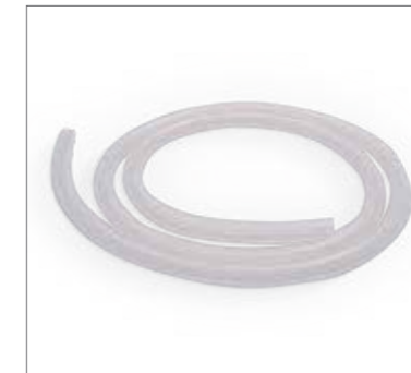
3 Артикул 000.0013.0