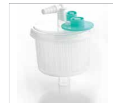
3 Артикул 340.0061.0