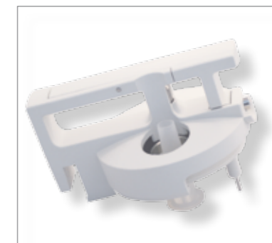
3 Артикул 444.0015.0