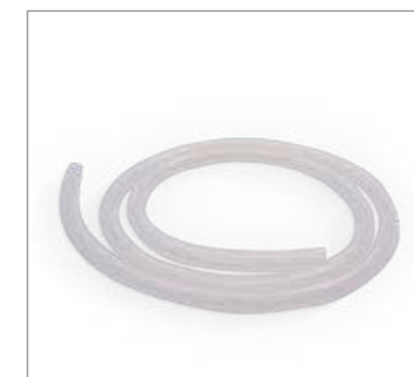
2 Артикул 000.0013.0