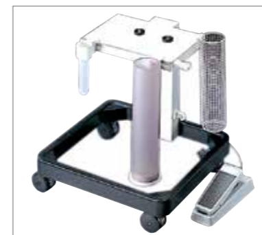
1 Артикул 444.0020.0