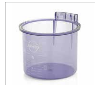
2 Артикул 340.0050.0