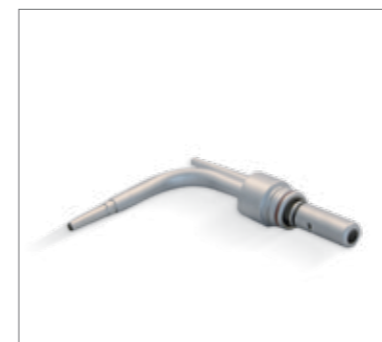
4 Артикул 444.0012.0