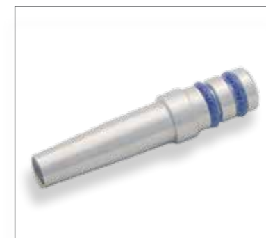
5 Артикул 444.0013.1