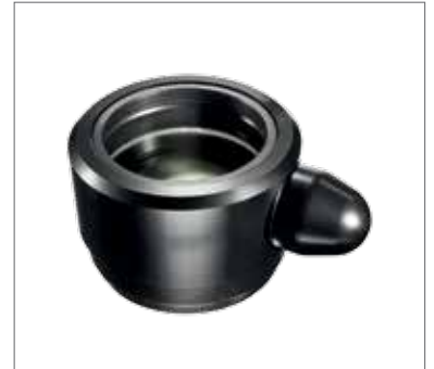
3 Объектив с ручной фокусировкой (200/250/300/400 мм)