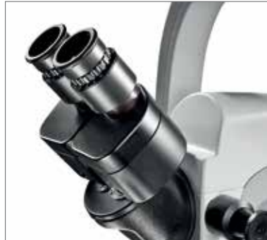
2 Бинокулярный угловой тубус