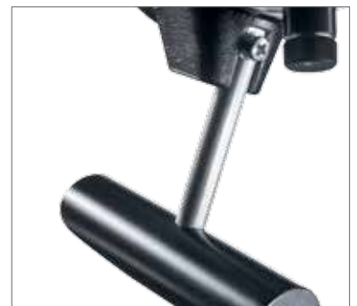
9 Т-образный захват