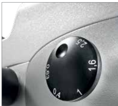
7 Переключатель увеличения