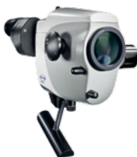
ATMOS® iView 31