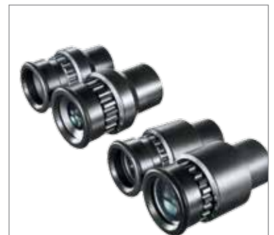
6 Широугольные окуляры 10 x Широугольные окуляры 16 x