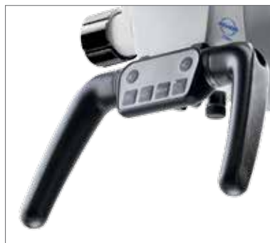
8 Поперечный двойной захват