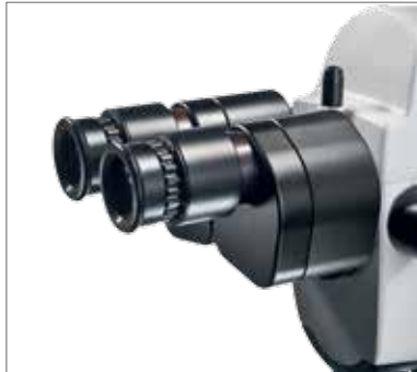
1 Прямой бинокулярный тубус