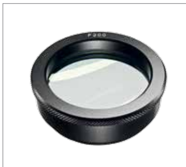
4 Объектив (200/250/300/400 мм)