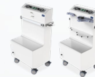
ATMOS TWIN RECORD 55