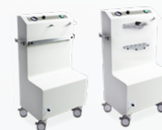
ATMOS RECORD 55