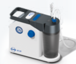
ATMOS LC 27