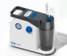
ATMOS LC 27 Battery