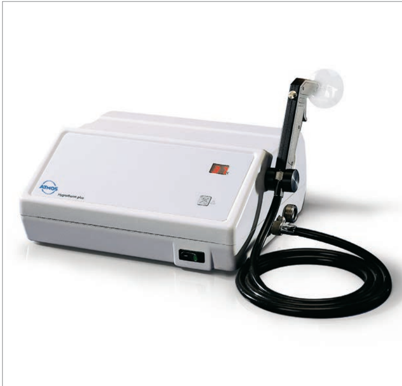
1 ATMOS Hydrotherm plus