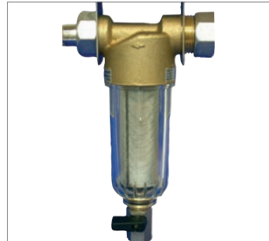
2 Wasservorfilter für HNO-Units