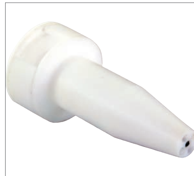
3 Spülansatz zur thermischen Reizung