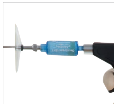
6 Hygienefilter für Wasserspülung