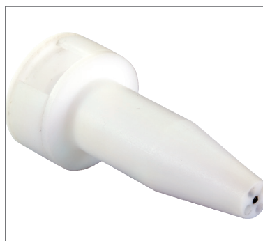
3 Spülansatz zur thermischen Reizung