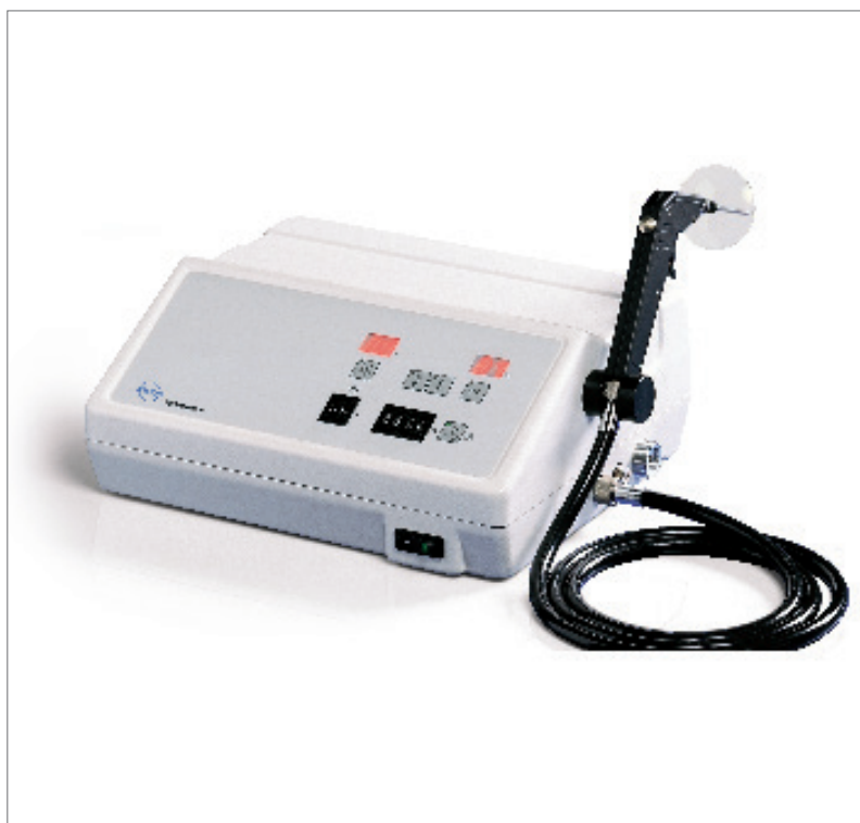
1 ATMOS Variotherm plus