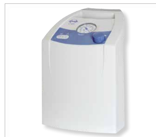
2 Артикул 340.0300.0