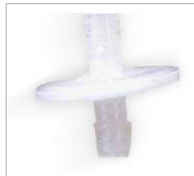
3 Артикул 443.0738.0