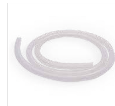
2 Артикул 000.0013.0