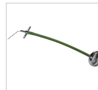
4 Артикул 404.0156.0