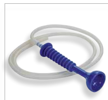
6 Артикул 404.0194.0