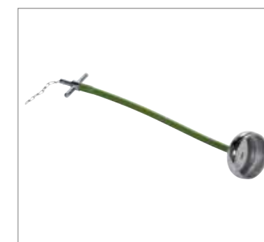
5 Артикул 404.0157.0