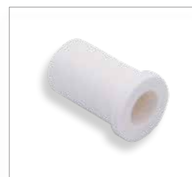
8 Артикул 340.0054.0