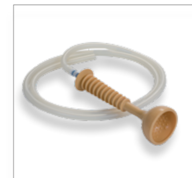
7 Артикул 404.0193.0