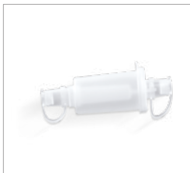
2 Артикул 401.0555.0