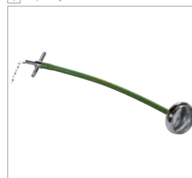
3 Артикул 404.0155.0