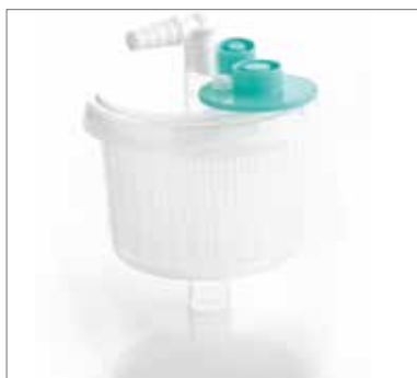
1 Артикул 340.0061.0