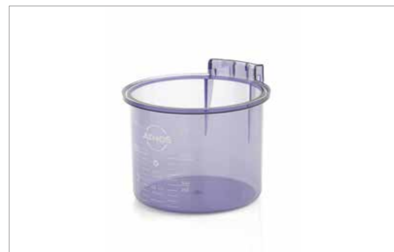
1 Артикул 340.0050.0