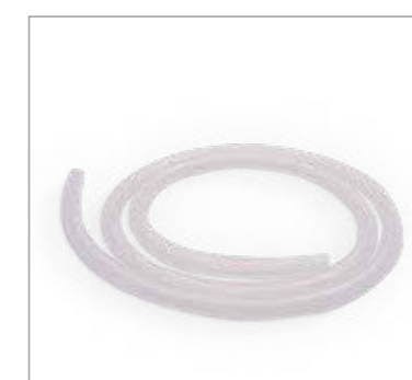
9 Артикул 000.0013.0