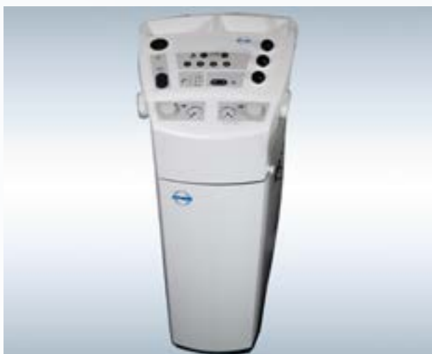
506.7530.0: White Edition Működtető torony élénkfehér színben (szignálfehér RAL 9003)