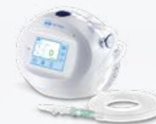
ATMOS C 051 Thorax