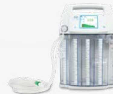
ATMOS S 201 Thorax